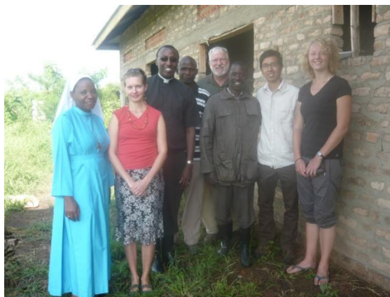
S dobrovolníky a ředitelem ACTS na našem pozemku