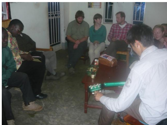
Párty s dobrovolníky z ACTS

Do nedaleké vesnice Kahija přišla skupina kanadských dobrovolníků organizace ACTS. Kromě jiných projektů, mají vodní projekt a program pro vdovy. Často jsme je navštěvovali a taky jsme uspořádali párty u nás. Podařilo se nám potkat i ředitele ACTS, kterému jsme ukázali naši stavbu a poprosili o pomoc při řešení problému jak dostat vodu na pozemek.