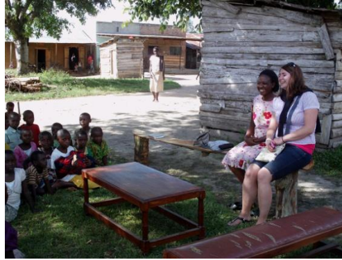
Na osvětové přednášce ve vesnici Ruzinga

V květnu jsme měli několik zajímavých pacientů. Jedním z nich byl novorozenec s těžkou oční infekcí, který byl velmi slabý, a jeho mladá jen osmnáctiletá matka se obávala, že zemře. Novorozenec se po léčbě úplně uzdravil. Taky jsme léčili roční holčičku s těžkou dehydratací a průjmem, která se po infusní léčbě zlepšila.