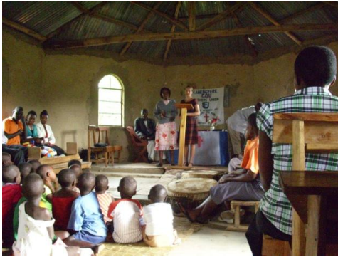
Osvětová přednáška v kostele v Kahengyere

V červnu naplno propuklo období sucha a taky přibyli pacienti s malárií na naší klinice. Měli jsme několik případů těžké malárie, i u malých dětí, proto jsme se rozhodli zorganizovat další osvětovou přednášku pro veřejnost. Přednáška byla v kostele ve vesnici Kahengyere a mluvili jsme o prevenci malárie, břišního tyfu a jiných nemocí a o správné výživě dětí a nemocných. Opět jsme nabádali rodiče, aby přišli na léčbu nemocným dítětem včas, ne když je dítě už vážně nemocné. Na klinice jsme často svědky toho, že rodiče donesou dítě až když je už dlouho nemocné a v tom případě je i léčba dlouhá a nemoc může zanechat následky. Na konci přednášky byl prostor na dotazy.